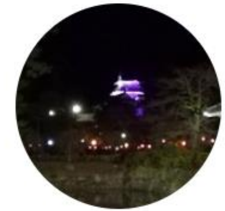
A.A. 日本語 オンライン